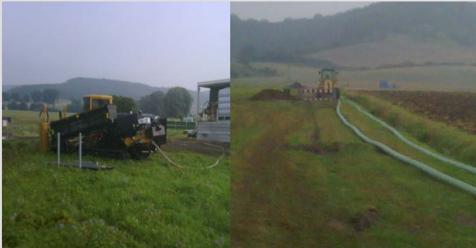
Abb. 3: Verlegung der Sureline Rohrleitung mittels Spülbohren

Die 20 Kontrollschächte und der Druckentlastungsschacht konnten werkseitig nach den individuellen Gegebenheiten vor Ort angefertigt werden und somit montagefertig zur Baustelle bzw. zum entsprechenden Einbauort angeliefert werden.