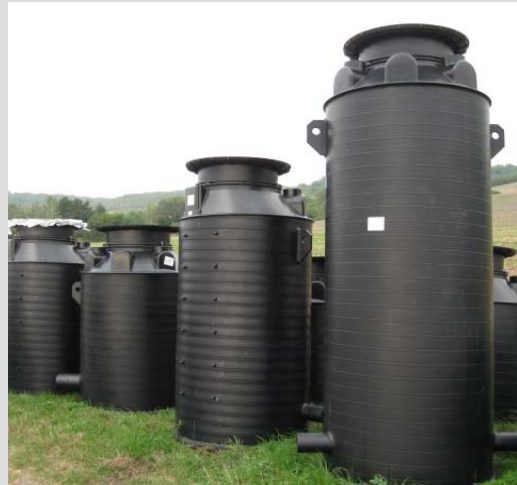
Abb. 4: PE-Wickelrohrschächte