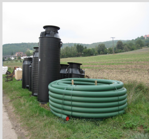
Abb.2: Kontrollschächte und d 125 mm Sureline-Ringbund für die erste Teilstrecke

Das Bauvorhaben beinhaltet neben den PE 100 RC Sureline Abwasserleitungen mit d 180 mm und d 125 mm (beide SDR 11), die mittels Spülbohrverfahren verlegt wurden, auch PE-Wickelrohrschächte mit Konus. Insgesamt handelte es sich um zehn Kontrollschächte für d 180 mm Anschluss, zehn Kontrollschächte für d 125 mm Anschluss und einen Druckentlastungsschacht.