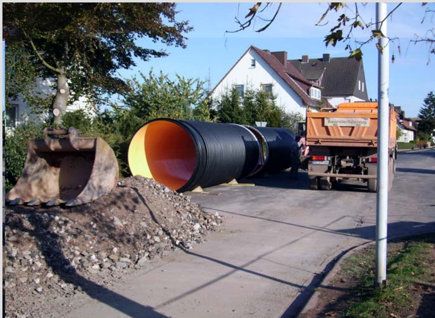
Abb. 3: Stauraumkanal Hanacht

Der Fachmann unterstrich aber auch, dass beständiges Rohrmaterial nichts nütze, wenn die Bauarbeiten rundherum schlecht ausgeführt würden. Aufgrund erheblicher Schäden und hydraulischer Notwendigkeit wurde ein Austausch in der Dickerstraße notwendig. Der Auftraggeber entschied sich für die Lösung mit Profilkanalrohren (PKS) aus dem modernen Werkstoff PE 100 mit heller Innenschicht, um auch die Kamerabefahrbarkeit des Kanalsystems optimal zu nutzen (HNA von 17.10.2007).