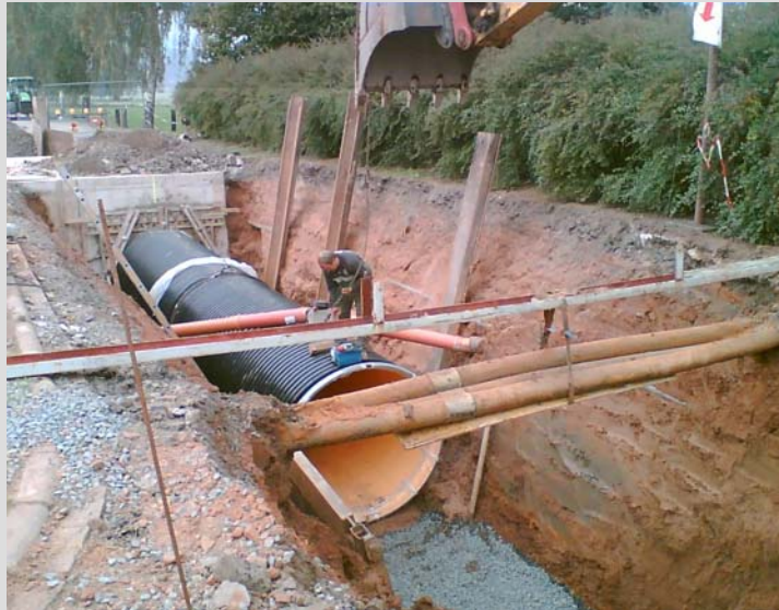
Abb. 2: Stauraumkanal Hanacht