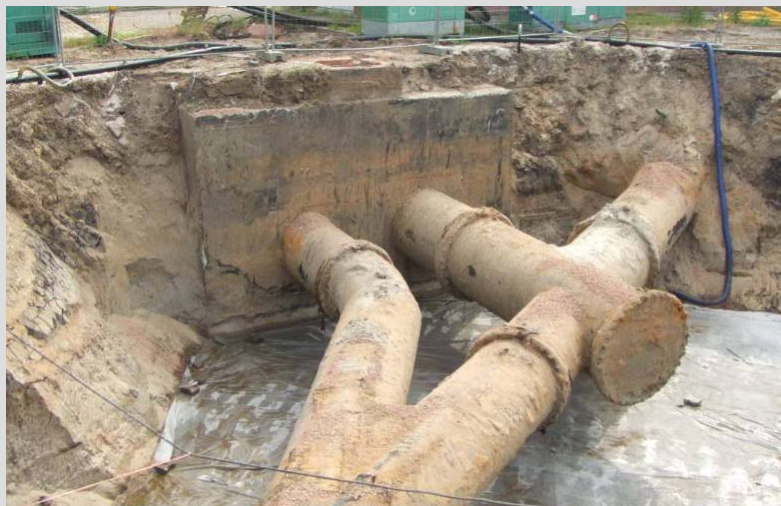
Abb. 1: Pumpen und Armaturenschacht alt

Bereits in den 1930er Jahren wurde der Riedkanal 1 gebaut. Er beginnt nördlich von Goddelau und mündet südlich von Erfelden in den Altrhein. Er transportiert bei normalem Wasserstand des Rheins das Wasser aus den ankommenden Gräben im Freispiegelabfluss zur Vorflut. Führt der Rhein jedoch Hochwasser, gibt es diese freie Ableitung nicht mehr, da der „Rheingegendruck“ dies verhindert. Aus diesem Grund wurde in den 1970er Jahren eine Pumpstation gebaut und ein PE-Liner in den alten Betonkanal eingezogen. Seither kann die Ableitung in den Rhein auch bei Hochwasser erfolgen. Die Freispiegelleitung wird bei Hochwasser zur Druckleitung, indem die Pumpen (2 x 250 l/s und 2 x 1000 l/s) das weiterhin anfallende Wasser gegen den Druck des Rheins abpumpen. Der Wasserverband Schwarzbachgebiet-Ried mit Sitz in Groß-Gerau betreibt nördlich von Riedstadt-Goddelau diese Hochwasserpumpstation.