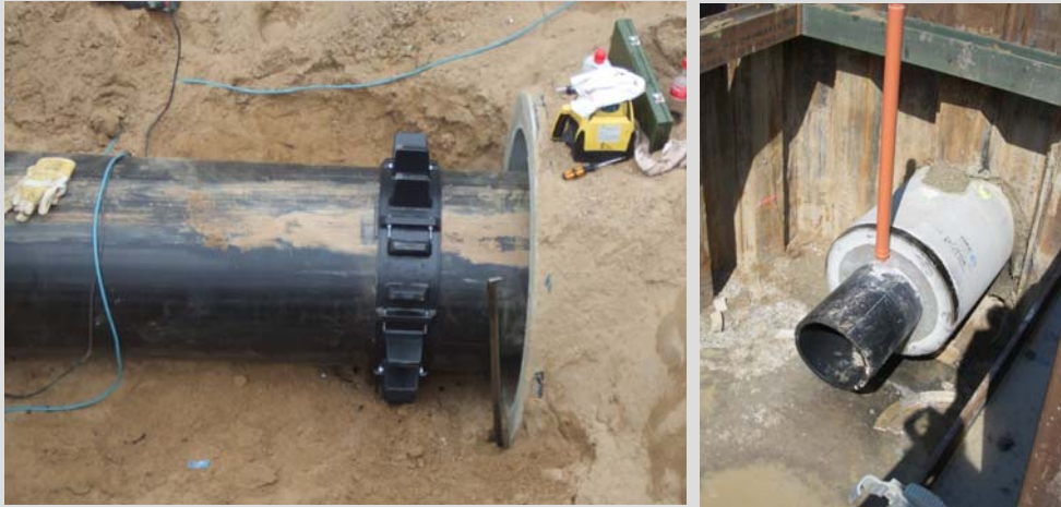
Abb. 7 und 8: PE-Rohr mit Gleitkufen; verdämmter Ringraum