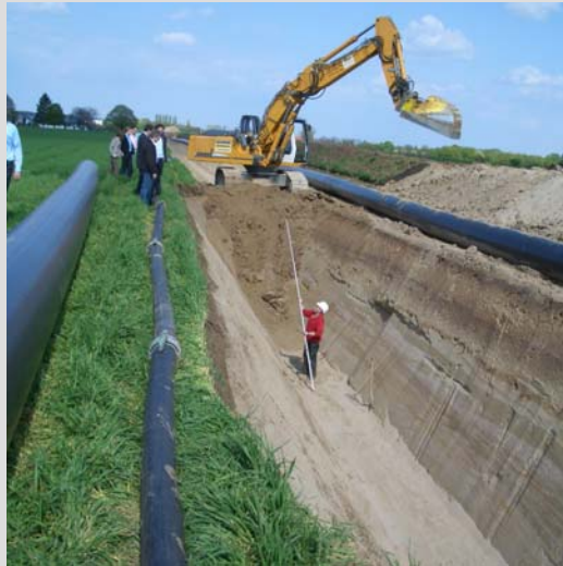
Abb. 11: Offene Bauweise mit geböschtem Graben

Die Bauarbeiten am Riedkanal 2 dauerten mit einer Besetzung von sieben Mann von Ende März 2008 bis Ende August 2008, so dass die gesamte Maßnahme nach fünf Monaten termingerecht fertig gestellt werden konnte.