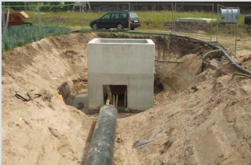
Abb. 4: Fertigteilschacht vor der Anbindung

Entlang der 2.300 m langen Trasse wurden ein Schieberschacht und sechs Revisionschächte als Fertigteilschächte eingebaut.