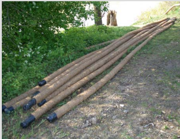
Abb. 9 und 10: Bohrgerät und Filterrohre für die Grundwasserhaltung

Die Trasse verläuft weitgehend in Ackergrundstücken und wurde in offener geböschter Bauweise ausgeführt. Nur an den Stellen der Straßenunterquerungen, den Kreuzungen mit Fernleitungen und beim Auslaufbauwerk war ein Verbau mit Spundbohlen oder Grabenverbau-elementen erforderlich.