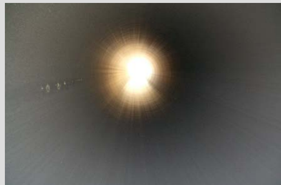
Abb. 2 und 3: Trasse mit PE-Rohr und glatter Rohrinnenfläche

Die Vorteile von PE-Rohren zum Transport von Oberflächenwasser waren den beteiligten Unternehmen seit vielen Jahren bekannt. Die entscheidenden Gründe für den Einsatz von Polyethylen bei dieser Baumaßnahme lagen jedoch in der Kombination von Wirtschaftlichkeit, geringem Gewicht, glatter Innenoberfläche und Schweißbarkeit, die der Werkstoff PE 100 bietet. Rohre und Formteile bringen durch das niedrige spezifische Gewicht von nur 0,96 g/cm 3 deutliche Vorteile in der Handhabung und Verlegung, was sich positiv auf anfallende Einbaukosten auswirkt. Der Rauigkeitsbeiwert k beträgt bei