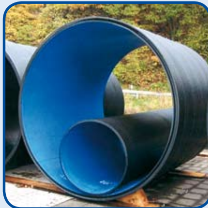
Coextrudierte Innen- und Außenfläche aus Sondermaterialien

Rohrleitungen können durch die Coextrusion z.B. mit einer inspektionsfreundlichen Innenschicht gefertigt werden. In explosionsgefährdeten Bereichen kann sowohl die Innenschicht als auch die Außenschicht aus einem leitfähigen Material produziert werden.