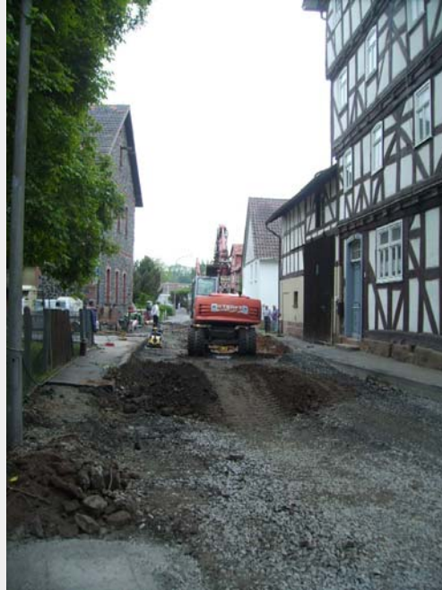
Abb. 4: historischer Bestand der Rosengasse