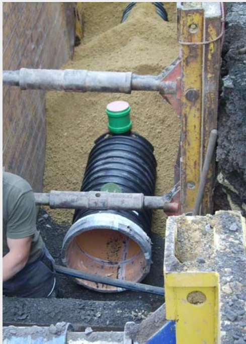
Abb. 3: Einbau im Verbau