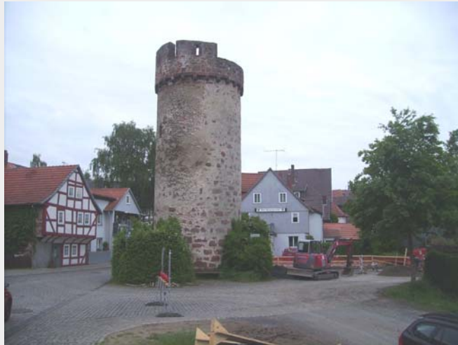
Abb. 1: Hexenturm am Anfang der Rosengasse

Im Rahmen der Erneuerung der städtischen Abwasserkanäle von Schwalmstadt-Treysa war eine hydraulische Erweiterung in der Rosengasse notwendig, da der Neubau eines Seniorenwohnheims für deutlich erhöhten Eintrag sorgen wird.