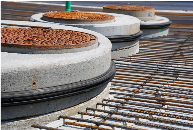
Baustellendetailansicht: Mauerkragen mit Spannbändern fixiert

Spannsystems bei Mauerkragen bis d 315 ist mit einem Schraubendreher möglich. Ab d 355 erfolgt der Einbau mit einem Spannwerkzeug.