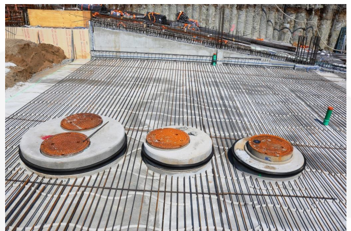
Baustellenansicht: FRANK Mauerkragen auf Betonrohre montiert